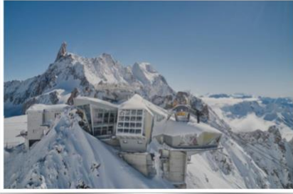
Punta Helbronner mt. 3446

"Meraviglie della Natura, della Tecnica e della Scienza"