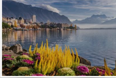
Ginevra - Lago Lemano